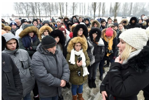
Voyage d'études à Auschwitz 2018

Un catalogue des animations propose près de 200 actions aux lycées et CFA des Académies de Strasbourg, Nancy-Metz et Reims, portées par plus de 100 associations régionales. Les équipes pédagogiques, lycéens et apprentis sélectionnent les projets qu'ils souhaitent développer afin de s'engager humainement pour des causes variées. On peut citer par exemple des créations artistiques, des débats, des visites de lieux de culte, des jeux interactifs, du théâtre, etc.