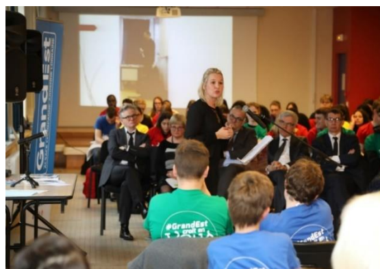
Lancement du Mois de l'Autre 2018

Chaque année, au mois de mars se déroule le point d'orgue du « Mois de l'Autre » : les traditionnelles « Rencontres Régionales du Mois de l'Autre », sous le haut-patronage du Conseil de l'Europe, à Strasbourg. Cet événement permet ainsi à plus de 700 jeunes d'échanger sur les actions menées dans leurs établissements.