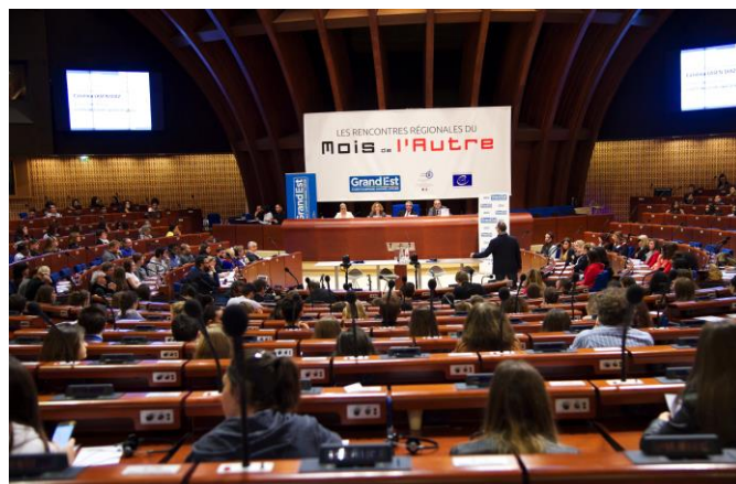
« Mois de l'Autre » 2017