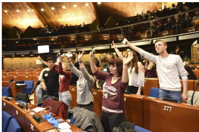
« Mois de l'Autre » 2016